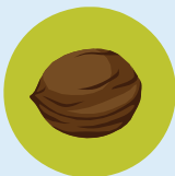
Tout kalite nwa